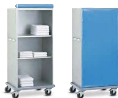
Transport sauberer Wäsche