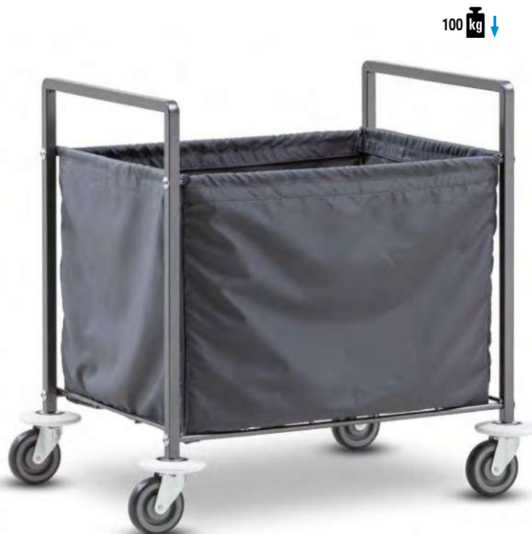
LT 240 Sackwagen