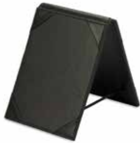
Tischaufsteller Table Stands