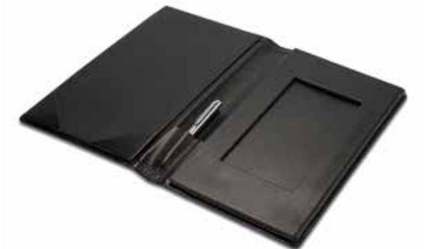
Rechnungsmappen Bill Folders