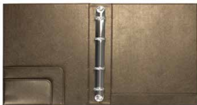
Informationsmappen Information Folders