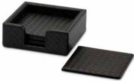
Coaster-Sets Coaster Sets