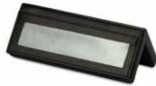
Reserviertische Reserved Signs