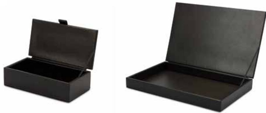
Aufbewahrungsboxen Storage Boxes