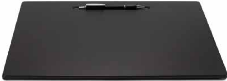
Rezeptionsauflagen Reception Blotters