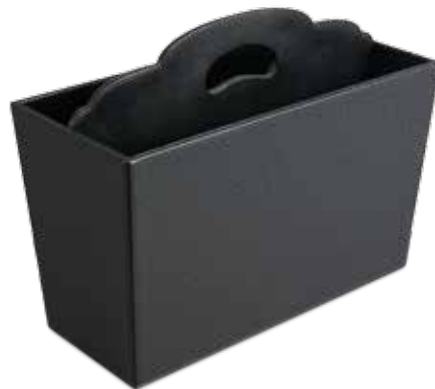
Zeitschriftenhalter Magazine Holders