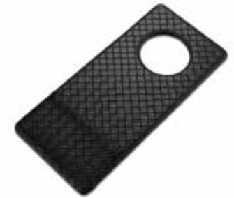
Türhänger Door Hangers