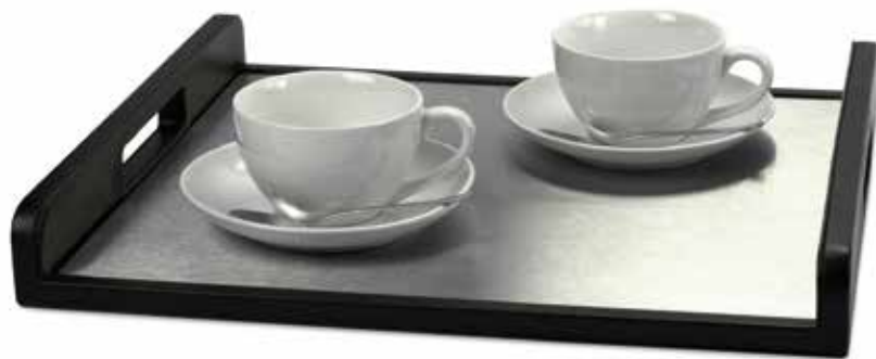
Kaffee- & Teetablets In-Room Trays