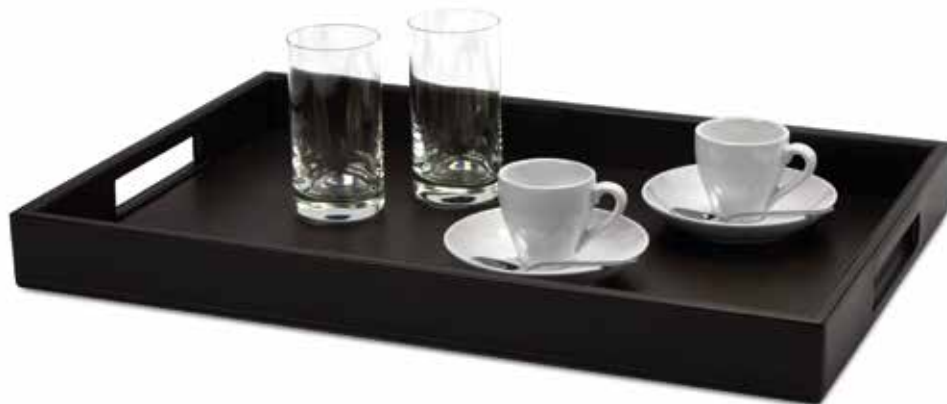
Serviertabletts Service Trays