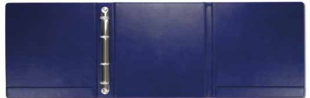
Informationsmappen Information Folders