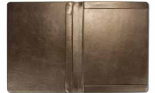
Speisekarten Menu Covers