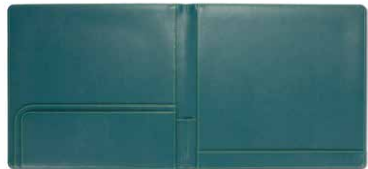
Gästemappen Guest Folders