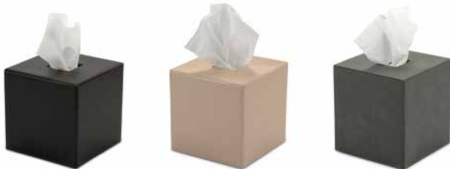
Kosmetiktuchboxen Tissue Box Covers