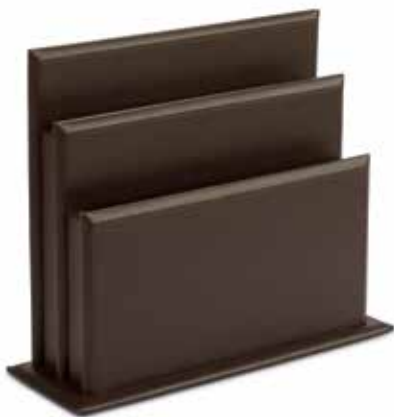
Prospektständer Brochure Holders