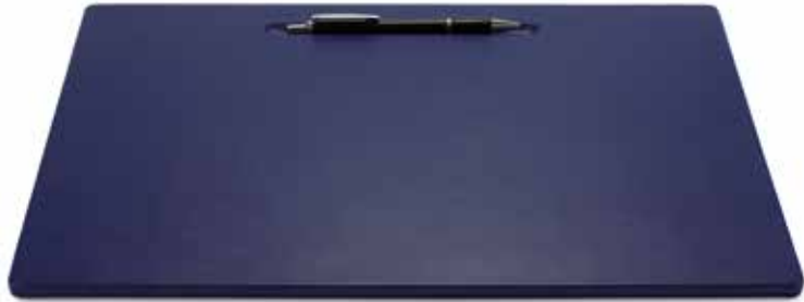
Schreibtischauflagen Desk Blotters