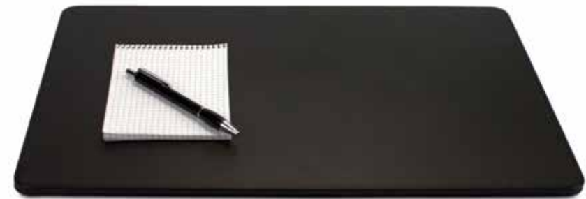
Schreibtischauflagen Desk Blotters