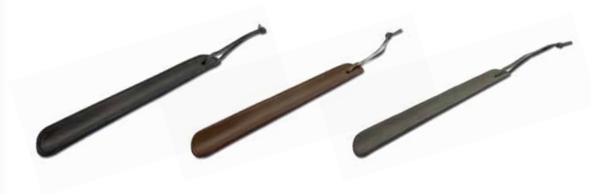
Schuhanzieher Shoe Horns