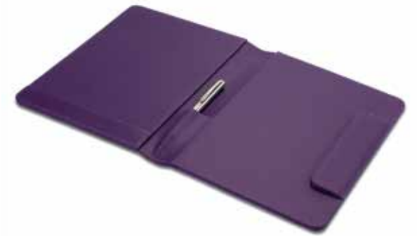
Rechnungsmappen Bill Folders