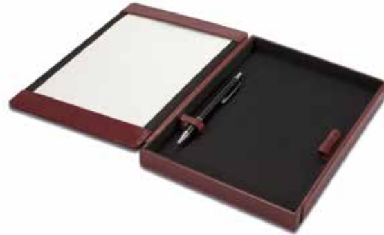
Rechnungsboxen Bill Boxes