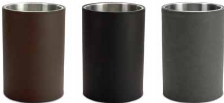
Papierkörbe Waste Bins