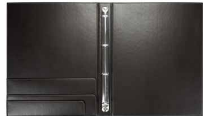
Anreisemappen Check-In Folders