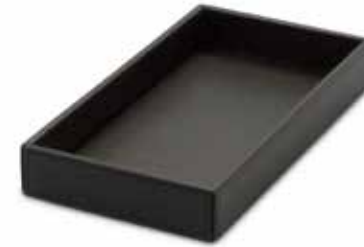
Schmucktablets Jewellery Trays