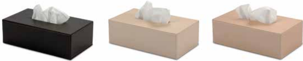
Kosmetiktuchboxen Tissue Box Covers