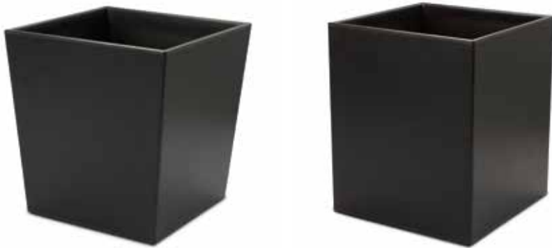
Papierkörbe Waste Bins