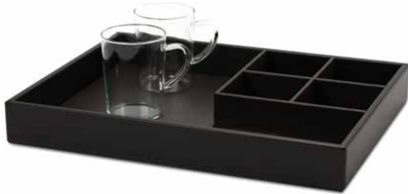
Kaffee- & Teetabletts In-Room Trays